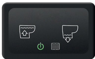
Toalettens funktion styrs från spolpanelen.