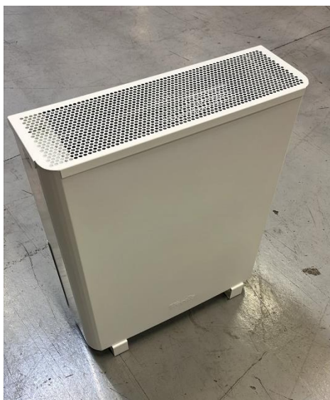
Figur 2. Wood's, Modell: AL310EU, Produktnummer: WAP311FC/EU