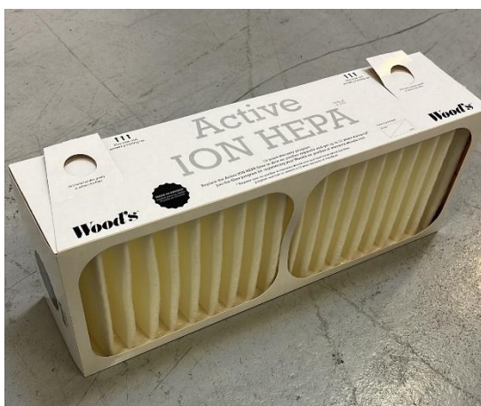
Figur 4. Tillhörande filter