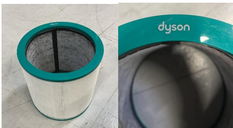
Figur 4. Tillhörande filter