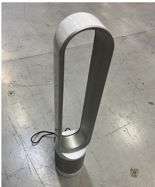
Figur 2. Dyson, Modell: Pure Cool TP00, Seriennummer: W8Z-EU-REB4216A