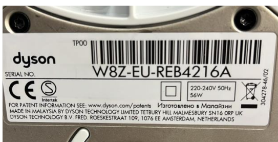
Figur 3. Märkning