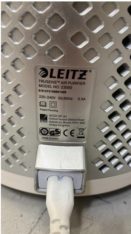
Figur 3. Märkning