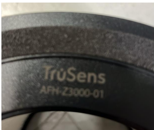
Figur 4. Tillhörande filter