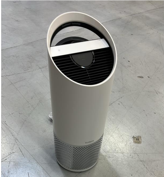
Figur 2. Leitz, Modell: TruSens Z-3000, Seriennummer: CF2106901059