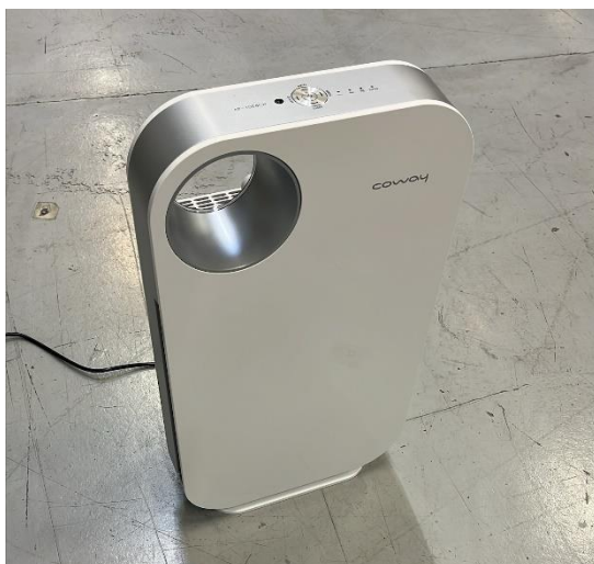
Figur 2. Coway, Modell: AP-1008CH, Seriennummer: 151 02DFR 22C14 00549