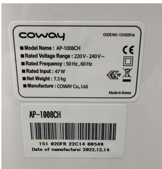
Figur 3. Märkning