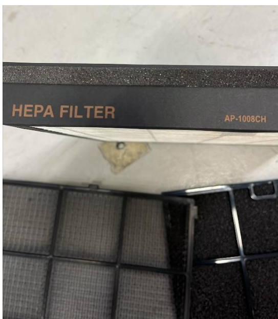
Figur 5. Tillhörande filter