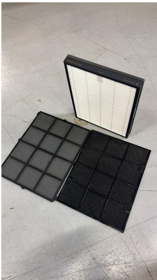
Figur 4. Tillhörande filter