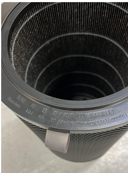
Figur 5. Tillhörande filter