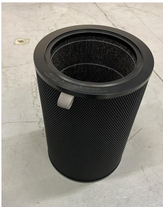
Figur 4. Tillhörande filter