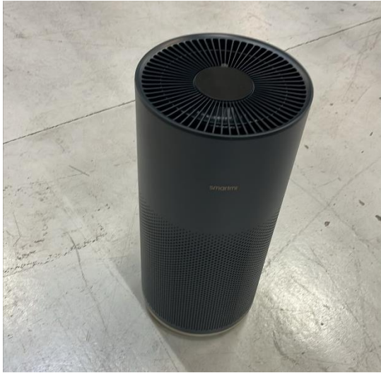
Figur 2. Smartmi Air Purifier 2, Modell: KQJHQ02ZM, Serienummer: 50101900006731