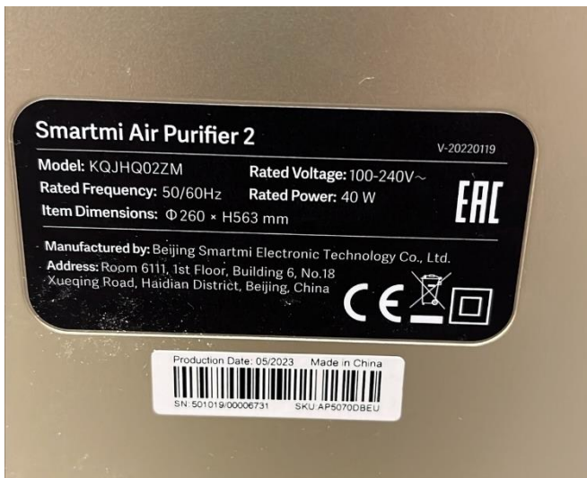
Figur 3. Märkning